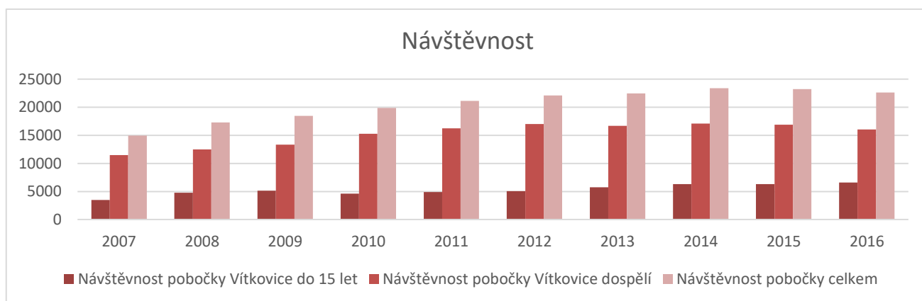
Graf č. 2