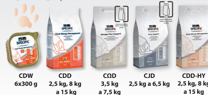
CDW 6x300 g

CJD Joint Support (granule) – dieta určena pro podporu správné funkce kloubů u dospělých psů a seniorů. Dále u psů s predispozicí k osteoartritidě (genetické predispozice, kloubní problémy, úraz, nadváha...) a u psů s osteoartritidou.