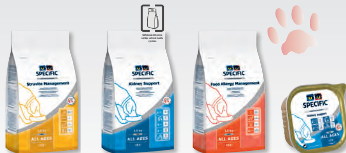
CCD 2,5 kg, 8 kg a 15 kg

Při poruchách funkce ledvin se používá dieta CKD / CKW Heart & Kidney Support , která má především snížený obsah bílkovin, fosforu a sodíku.