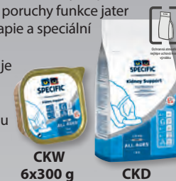
CKW 6x300 g

CKD/CKW Heart & Kidney Support = snížený obsah bílkovin, sodíku, fosforu a mědi. Obsahuje L-karnitin a taurin.